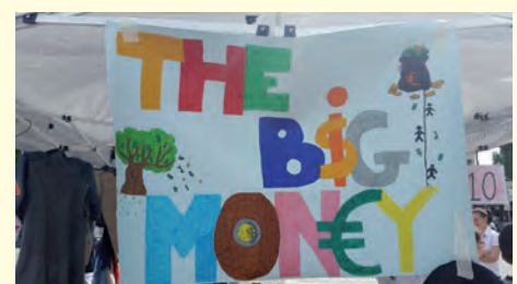
The b$g Mon€y