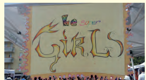
Le super Girls