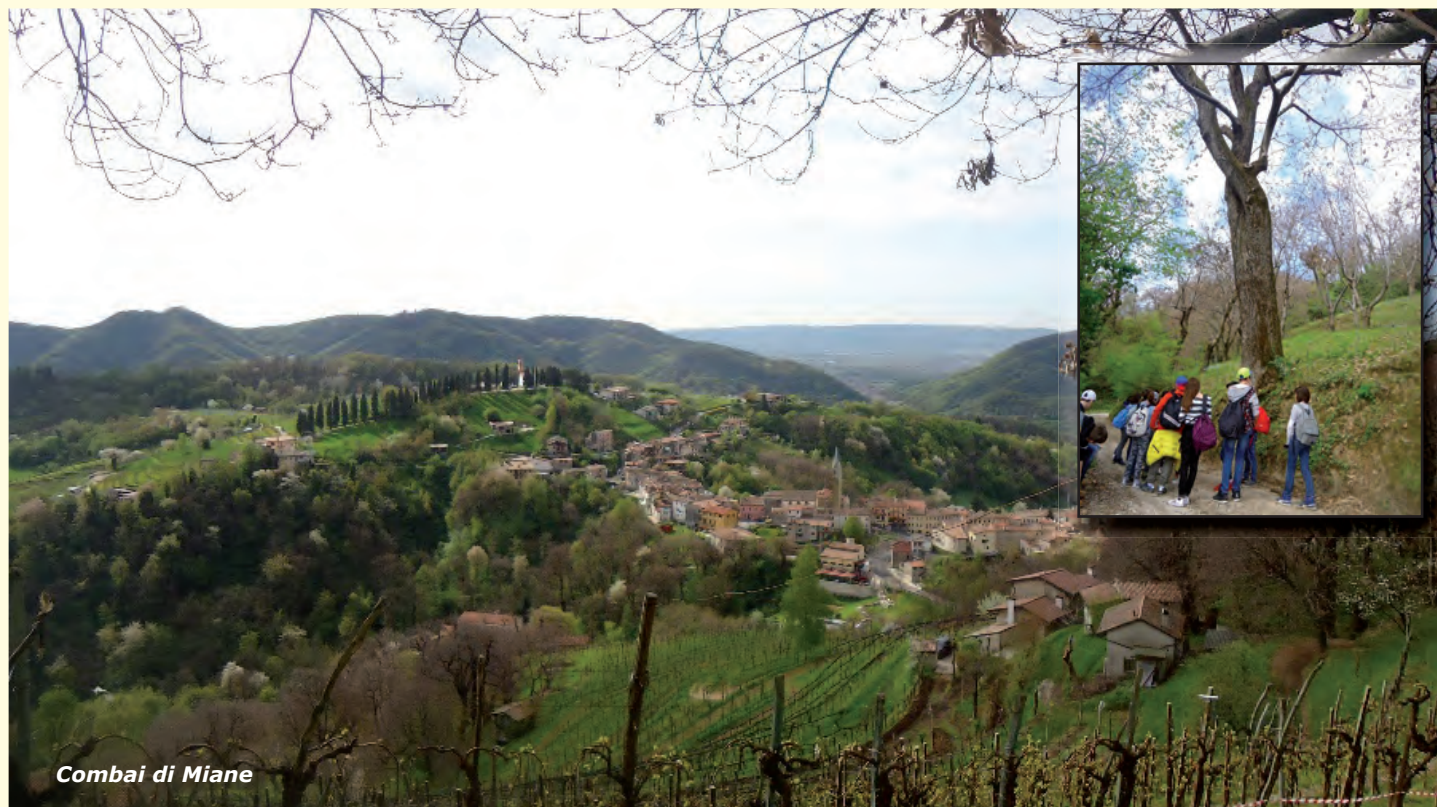
Combai di Miane

La redazione de "La Pignera", giornale interno dell'Istituto Comprensivo Statale di Caerano di San Marco (TV), è costituita da: