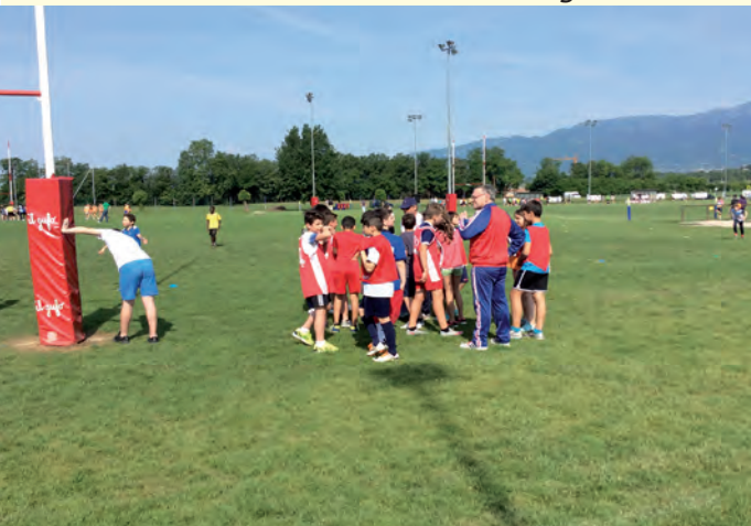
Maggio. Torneo Rugby Asolo - Classi Prime Secondaria