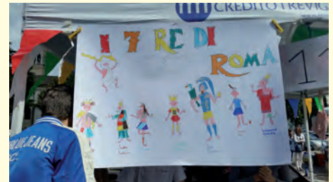
I tre di Roma