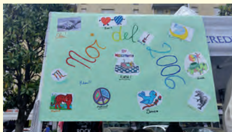
Noi del 2006