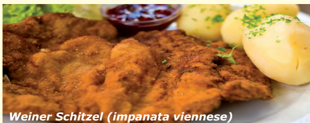
Weiner Schitzel (impanata viennese)

Il viaggio in Austria è una di quelle esperienze che non si dimenticano facilmente. Tutto è partito da quando ci è arrivato il comunicato che il 29 aprile saremmo partiti.