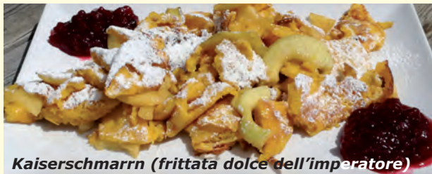
Kaiserschmarrn (frittata dolce dell'imperatore)