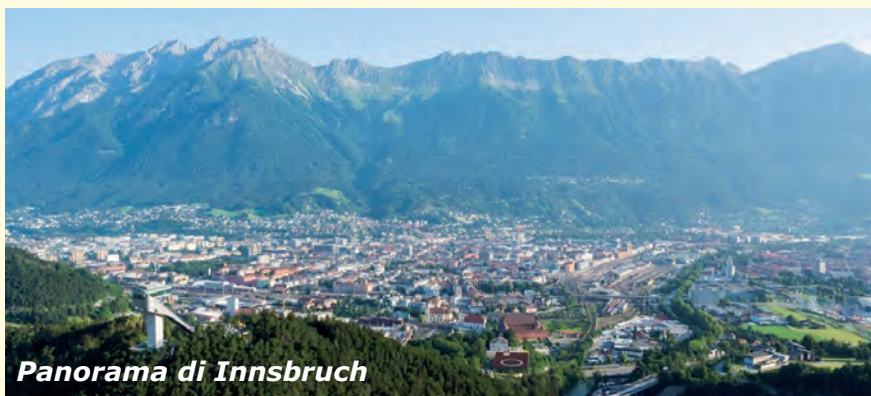
Panorama di Innsbruck

Quest'anno noi ragazzi delle classi terze siamo andati in Austria, per sei giorni, a Radfeld per un viaggio-studio.